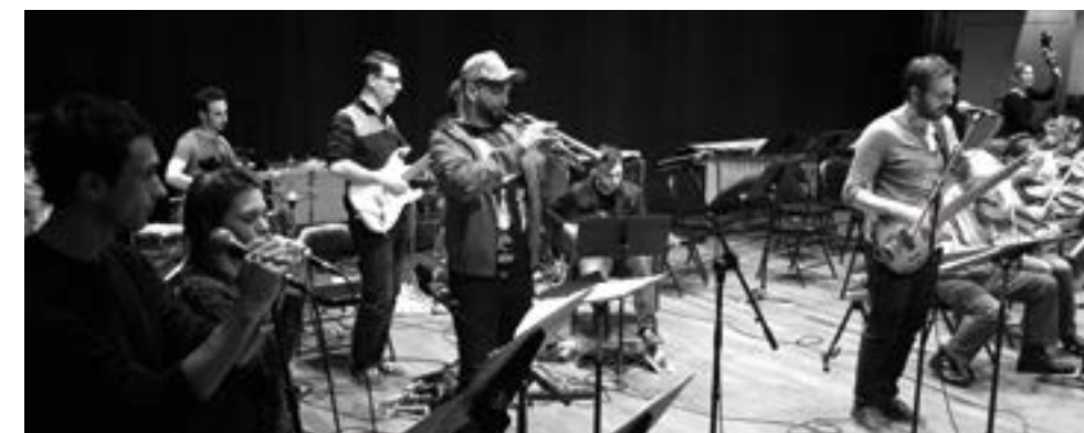
Nyx Kalupsis, création avec Les Comptes de Korsakoff - La Traverse